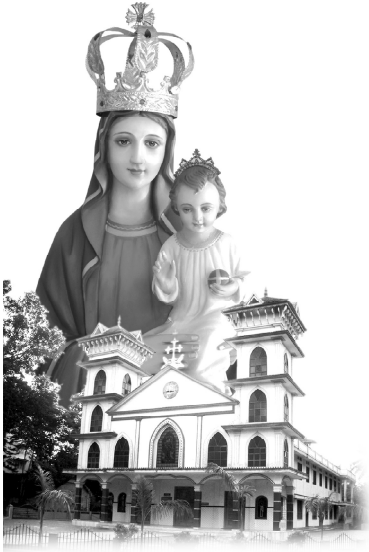
നിർമ്മലാംബികേ തങ്ങൾക്കുവേണ്ടി അപേക്ഷിക്കണമേ