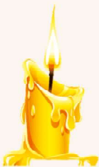
പോൾ വർഗീസ് കല്ലുകൾ