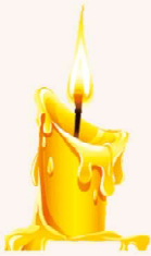
എം.റ്റി. അലക്സാണ്ടർ മണലിൽ